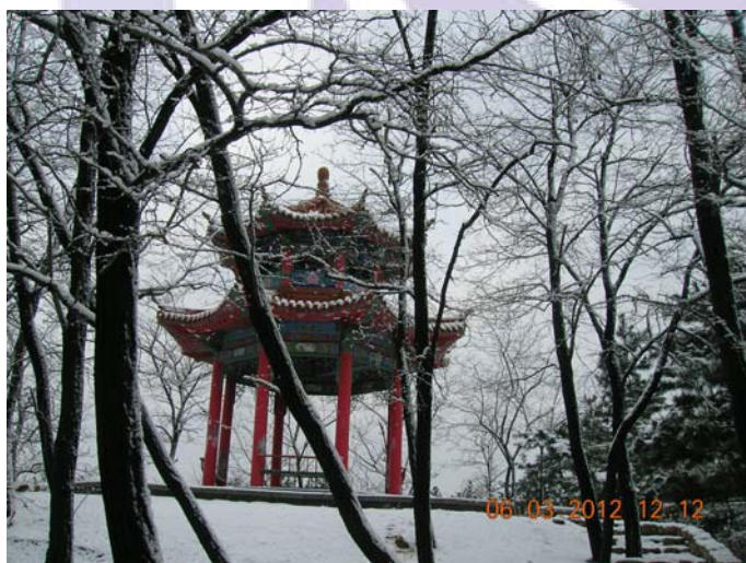
(住まい近くの「跑台山公園」景色)

季節は毎年多少のずれがあるものの、人々に対して平等にやってくる。先日、西暦2012年となり中国の旧暦春節も終わったと思ったら、何時の間にか弥生「3月」になってしまった。帯状疱疹と悪戦苦闘しほぼ一ヶ月が経過し、漸く、正常に戻つつある健康状態に改めて感謝である。人は誰も自分の健康は大丈夫と思いがちであるが、矢張り定期的なメンテナンスは必要であると感じた。企業で働く場合、毎年定期健康診断を1回は受検する機会があるが、組織を離れると自分のことは全て自分で管理しなければならず、往々にして自分を過信し健康診断を等閑にしがちである。例えば悪いが「新車」を購入すると3年目(日本の場合)に車検があり、以降は2年に1回車検を受けねばならない。工業製品と違い人間は生身であり、特に心臓は生きている限り鼓動を続け、休むことはないだけに負担も大きいはずで、加齢するにつれケアが必要なのかも知れないと感じるようになってきた。取りとめもないことを記したがご容赦下さい。